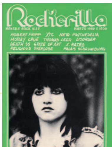
N°22 - Marzo 1982 Lydia Lunch - Robert Fripp - XTC - Death SS - Religious Overdose - Palais Schaumburg - Motley Crue - Cirith Ungol - Disorder - X Rated - State Of Art.