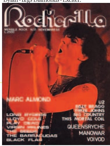
N°51 Novembre 1984 Marc Almond - Barracudas - Virgin Prunes - Long Ryders - Lloyd Cole and the Commotions - Black Flag - Play Dead - Seeds - The Meteors - Manowar - Queensryche - Halloween.