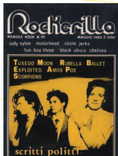
N°24 Maggio 1982 Scritti Politti - Exploited - Chron Gen - Rubella Ballet - Depeche Mode - Tuxedomoon - Misty - Amos Poe - Motorhead - Krokus - Scorpions.