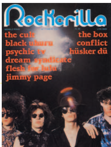
N°49 Settembre 1984 Sisters Of Mercy - Flesh For Lulu - Dream Syndicate - Black Uhuru - Cult - British Minor Psychedelia part 2 - Psychic TV - Jarmusch & Poe - Jimmy Page - Bulldozer.