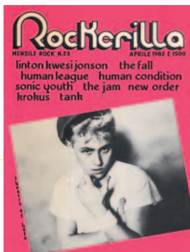
N°23 - Aprile 1982 Theatre Of Hate - L. K. Johnson - Fall - Sonic Youth - Love Tractor - REM - Fall Out - Anti Nowhere League - Human League - B Sides - Eazy Con - Knife Edge - Levi Dexter - New Order.