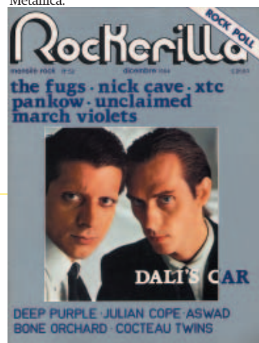
N°52 Dicembre 1984 Dali's Car - Unclaimed - XTC - Nick Cave - March Violets - Aztec Camera - Pankow - Skeleton Crew - The Fugs - Raw Power - Gene Vincent - Deep Purple - Wendy O'Williams.

Inviare 7 euro per ogni copia tramite vaglia postale intestato a: Edizioni Rockerilla Strada Carnovale 68 - 17014 Cairo Montenotte (Sv) indicando i numeri richiesti e l'indirizzo del destinatario