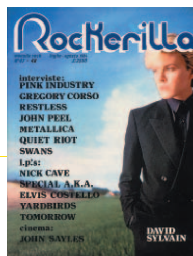
N°47/48 Luglio/Agosto 1984 David Sylvian - Pink Industry - Swans - Einsturzende Neubauten - Gregory Corso - John Peel - Psychedelic Furs - Plasticland - Nomads - Cramps - British Minor Psychedelia part 1 - John Sayles - Restless - Quiet Riot - Metallica.